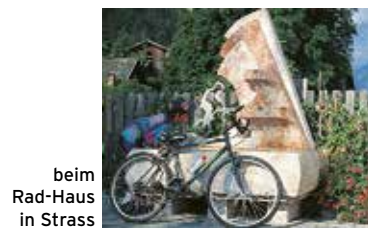
beim Rad-Haus in Strass