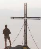
Saualpe – Balkon Kärntens

Jeder Teilnehmer, der drei Routen bewältigt hat, bekommt die Wanderweltmeister-Urkunde (€ 2,-) verliehen. Jene zehn Vereine, deren Mitglieder die meisten Kilometer erwandern, werden zum Gruppen-Wanderweltmeister gekürt. Jede Rückmeldung nach absolvierter Wanderstrecke wird pro Wanderer registriert und für die Gruppe gewertet. Die Gruppenzugehörigkeit ist bereits bei der Anmeldung bekanntzugeben. Für die Gruppenwertung gelten nur Voranmeldungen und es werden nur jene Teilnehmer gewertet, die mindestens drei Routen (Einzel-Wanderweltmeister) bewältigt haben.